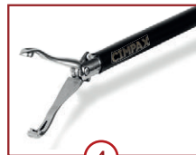
4 C-BAB 22mm Maullänge