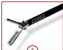
5 C-GRASP 18mm Maullänge