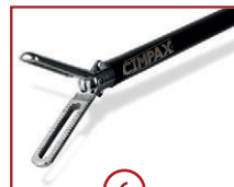
6 C-GRASP 22mm Maullänge