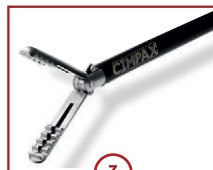
3 C-CLINCH 22mm Maullänge