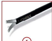
1 C-CUT 17mm Klingenlänge