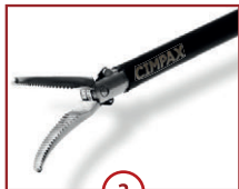
2 C-DISSECT 20mm Maullänge