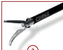
2 C-DISSECT 20mm Maullänge