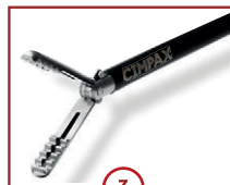
3 C-CLINCH 22mm Maullänge